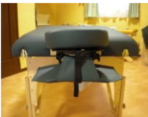
アームスリング取り付け完成図