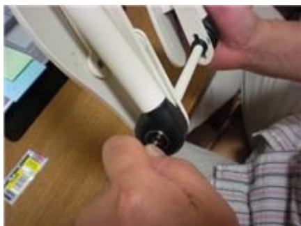
内側の穴には、直径3mmの六角レンチを使用します。