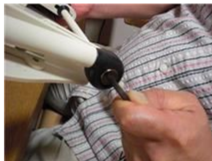
外側の穴には、直径 5mm の六角レンチを使用します。

上の写真のように、六角レンチをヘッドレストの土台のレバーとは反対側の六角のネジ穴に入れて、レザールの締め具合を調整することができます。